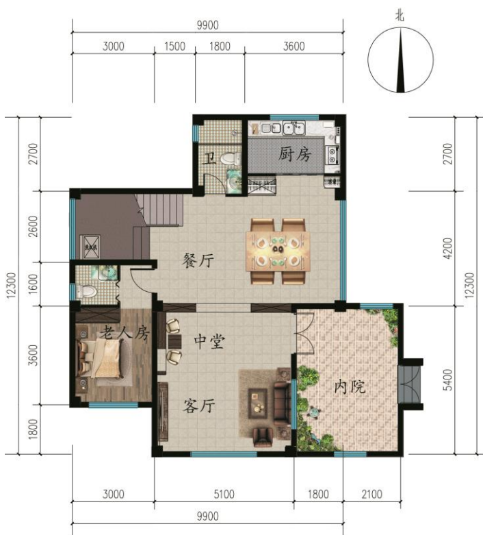
一层平面图 本层建筑面积99m 2