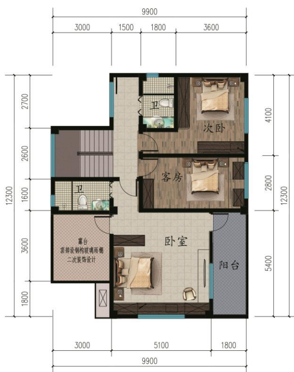
二平面图 本层建筑面积102.3m 2